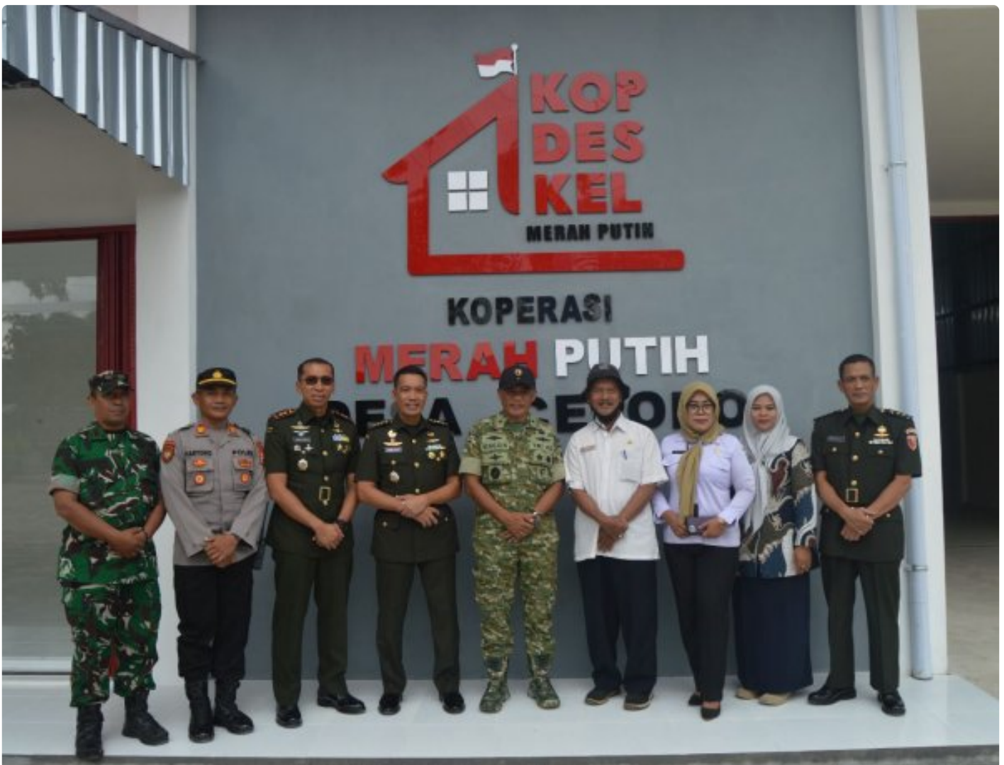
Dandim 0804/Magetan Dampingi Kapok Sahli Pangdam V/Brawijaya Tinjau Pembangunan Koperasi Merah Putih